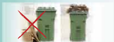
Mauvaise manière Bonne manière